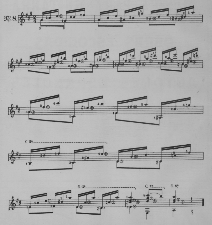
Propiedad de los Editores para todos los paises.